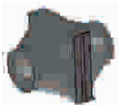
Deslize a tampa para o lado