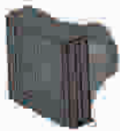
Deslize a tampa para o lado