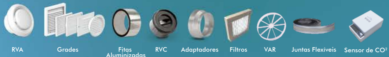
RVA Grades Fitas Aluminizadas RVC Adaptadores Filtros VAR Juntas Flexíveis Sensor de CO 2